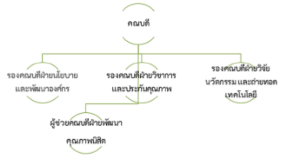
ภาพที่ 1 ก) โครงสร้างองค์กร ข) โครงสร้างการบริหารองค์กร

(2) ผู้เรียน ลูกค้ำกลุ่มอื่น และผู้มีส่วนได้ส่วนเสีย กลุ่มผู้เรียนสำหรับระดับปริญญาตรี คือ นักเรียน/บุคคลที่สำเร็จการศึกษาระดับมัธยมปลายหรือเทียบเท่า และมีคุณสมบัติตามที่หลักสูตรกำหนด กลุ่มผู้เรียนสำหรับระดับปริญญาโท คือ ผู้สำเร็จการศึกษาระดับปริญญาตรีที่ต้องการศึกษาต่อเพื่อ นำประกอบอาชีพเป็นอาจารย์ นักวิจัย กลุ่มผู้เรียนหลักสูตรระยะสั้น คือ ประชาชนทั่วไปที่มีความสนใจ ส่วนกลุ่มผู้มีส่วนได้ส่วนเสียคือ ผู้เรียน บัณฑิต ศิษย์เก่า ผู้ใช้บัณฑิต ผู้ปกครอง และชุมชน ซึ่งมีความต้องการและความคาดหวังต่อหลักสูตรและการบริการที่แตกต่างกัน ดังนี้